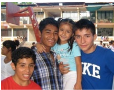
MEXICO (Desde 1954)

Todo ello se brinda en un entorno familiar, afectivo, seguro y saludable gracias al acompañamiento de los cuidadores locales, que se convierten en sus referentes y con quienes hacen vínculos de por vida.