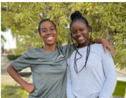
REP. DOMINICANA (Desde 2003)