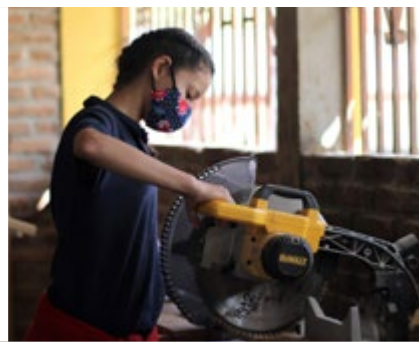
HONDURAS (Desde 1985)