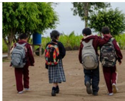
PERÚ (Desde 2004)