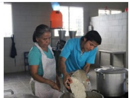
EL SALVADOR (Desde 1999)