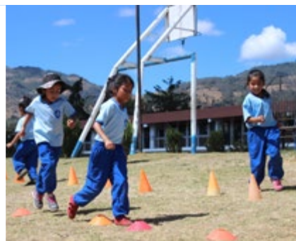
GUATEMALA (Desde 1996)