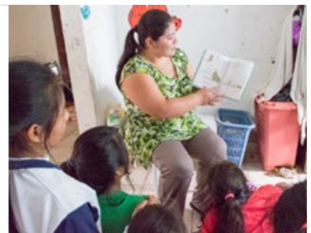
BOLIVIA (Desde 2005)