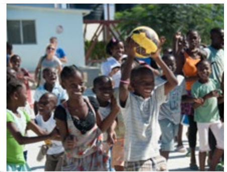
HAITÍ (Desde 1987)