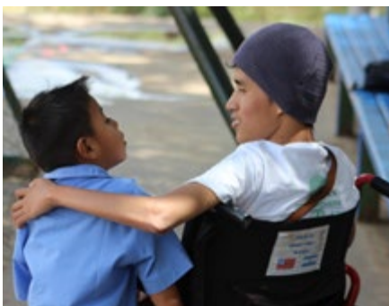
NICARAGUA (Desde 1994)