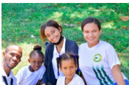
NPH República Dominicana