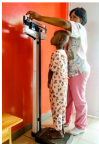
Hospital St. Damien