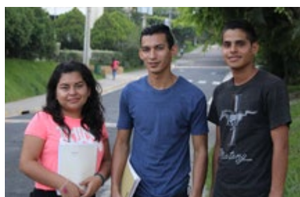
NPH El Salvador