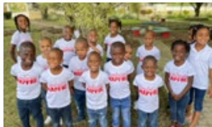
NPH República Dominicana