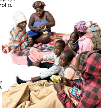
Refugiados en uno de los programas de NPH.

Nuestro dedicado personal sigue atendiendo a niños, pacientes y familias, demostrando una resiliencia y compromiso extraordinarios.